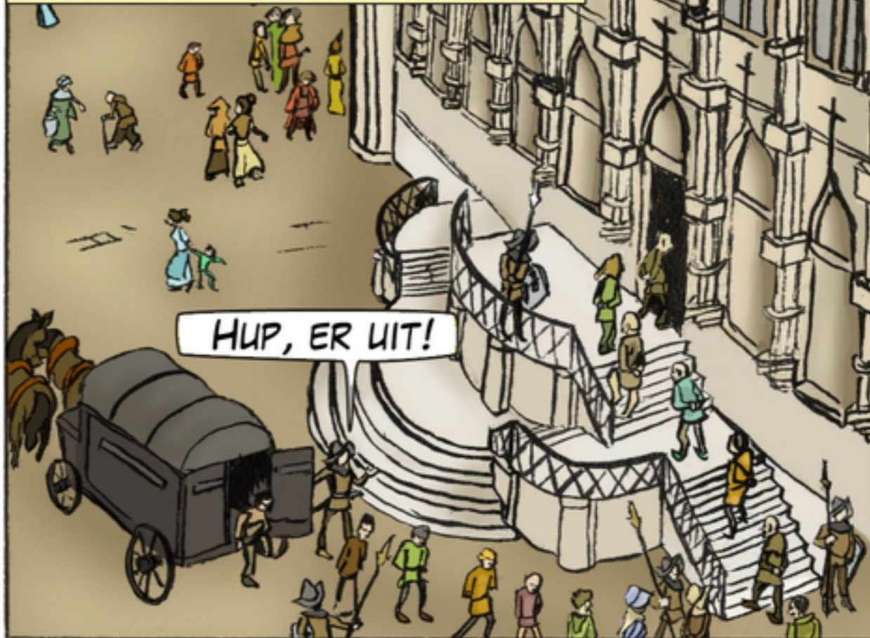
HUP, ER UIT!