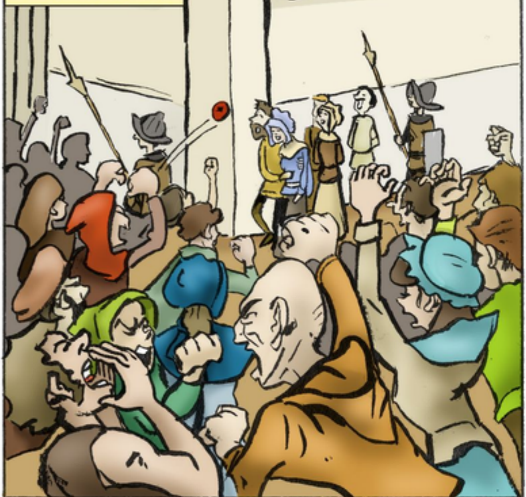
15 JUNI 1543.