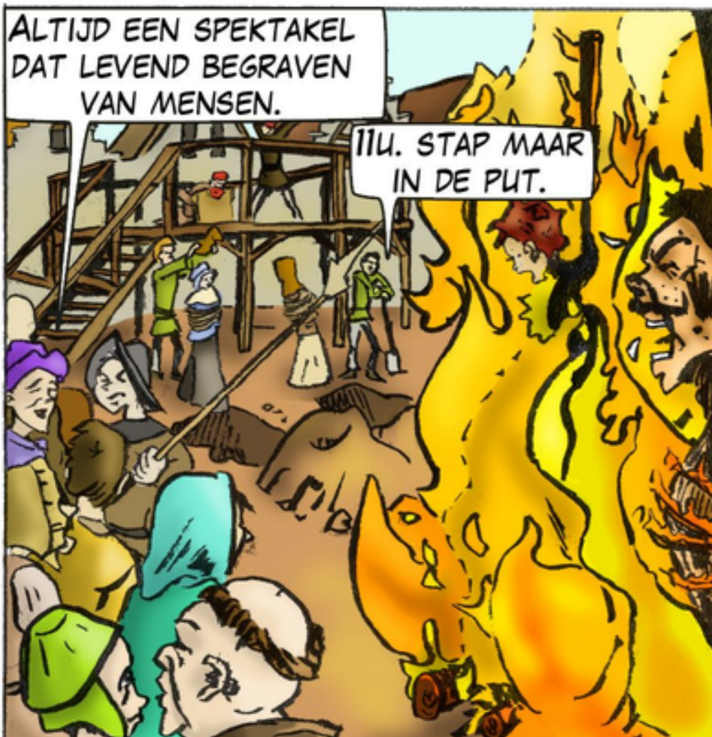
III. STAP MAAR IN DE PUT.