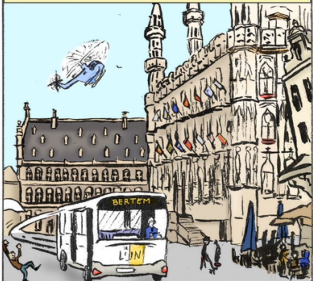
ZODAT TEGENWOORDIG BIJNA NIEMAND MEER AAN HEN DENKT...