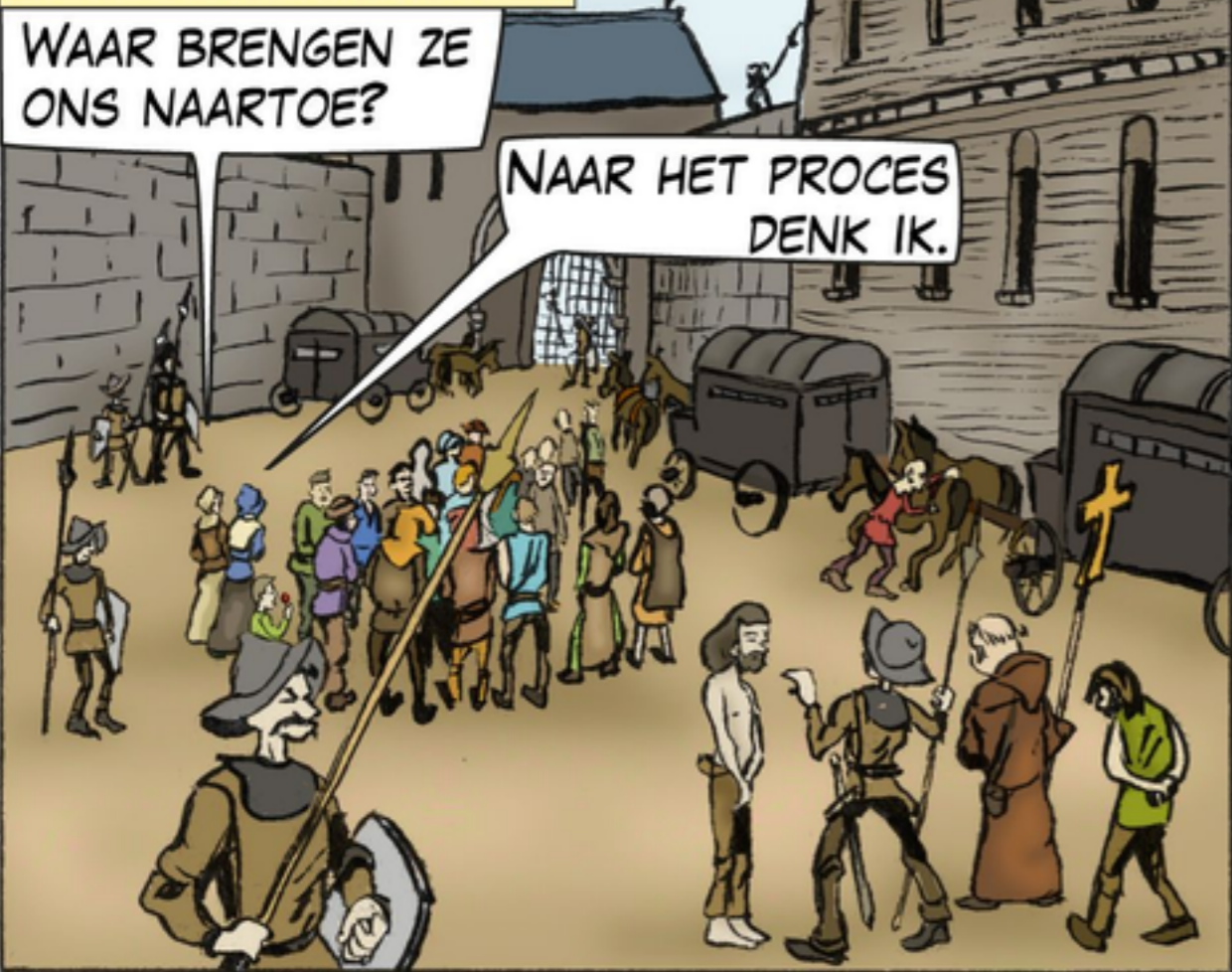
NAAR HET PROCES DENK IK.