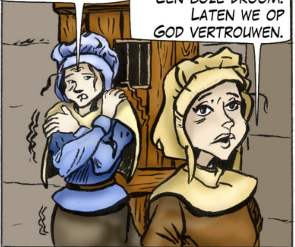
HET LIJKT ALLEMAAL EEN BOZE DROOM. LATEN WE OP GOD VERTROUWEN.